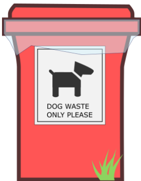
ਉਪਲਬਧ ਹੋਣ 'ਤੇ ਵਿਸ਼ੇਸ਼ ਤੌਰ 'ਤੇ ਚਿੰਨ੍ਹਿਤ ਡੱਬਿਆਂ ਦੀ ਵਰਤੋਂ ਕਰੋ।

ਗੰਦੀ ਬਿੱਲੀ ਦੇ ਕੂੜੇ ਵਿੱਚ ਇੱਕ ਪਰਜੀਵੀ ਹੋ ਸਕਦਾ ਹੈ ਜੋ ਮਨੁੱਖਾਂ ਲਈ ਖ਼ਤਰਨਾਕ ਹੈ ਅਤੇ ਇਸਨੂੰ ਕਦੇ ਵੀ ਖਾਦ ਨਹੀਂ ਬਣਾਉਣਾ ਚਾਹੀਦਾ, ਬਾਗਾਂ ਵਿੱਚ ਵਰਤਿਆ ਜਾਣਾ ਚਾਹੀਦਾ ਹੈ, ਜਾਂ ਦਸਤਾਨਿਆਂ ਤੋਂ ਬਿਨਾਂ ਹੈਂਡਲ ਕਰਨਾ ਚਾਹੀਦਾ ਹੈ ਅਤੇ ਬਾਅਦ ਵਿੱਚ ਚੰਗੀ ਤਰ੍ਹਾਂ ਹੱਥ ਧੋਣੇ ਚਾਹੀਦੇ ਹਨ।