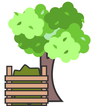
ਖਾਦ ਦੀ ਰਹਿੰਦ-ਖੂੰਹਦ ਨੂੰ ਪਾਣੀ ਦੇ ਸਰੋਤਾਂ ਅਤੇ ਭੋਜਨ ਬਾਗਾਂ ਤੋਂ ਦੂਰ ਰੱਖੋ।

ਇਹ ਗੁਗਲ ਟ੍ਰਾਂਸਲੇਟ ਦੁਆਰਾ ਚੰਗੇ ਇਰਾਦੇ ਨਾਲ ਅਨੁਵਾਦ ਕੀਤਾ ਗਿਆ ਸੀ, ਕਿਰਪਾ ਕਰਕੇ ਸਾਡੇ ਨਾਲ ਨਫ਼ਰਤ ਨਾ ਕਰੋ।